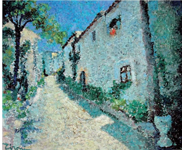
“Sense títol” - 46 x 55 cm Tècnica: mixta oli i materials naturals