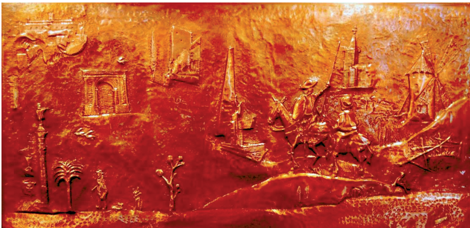
“Quijote i Sancho a Barcelona” 80 x 160 cm - Tècnica: coure forjat.