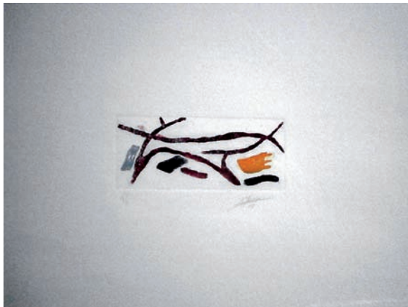
“Sense títol” 70 x 165 mm - Tècnica: Aiguafort i sucre