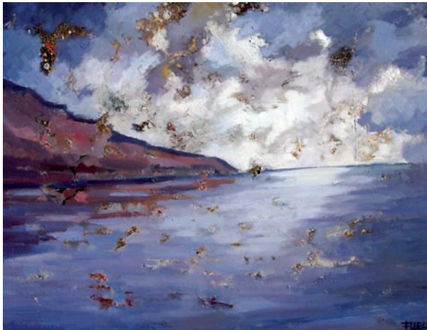
"Marina" 90 x 100 cm - Tècnica: mixta.