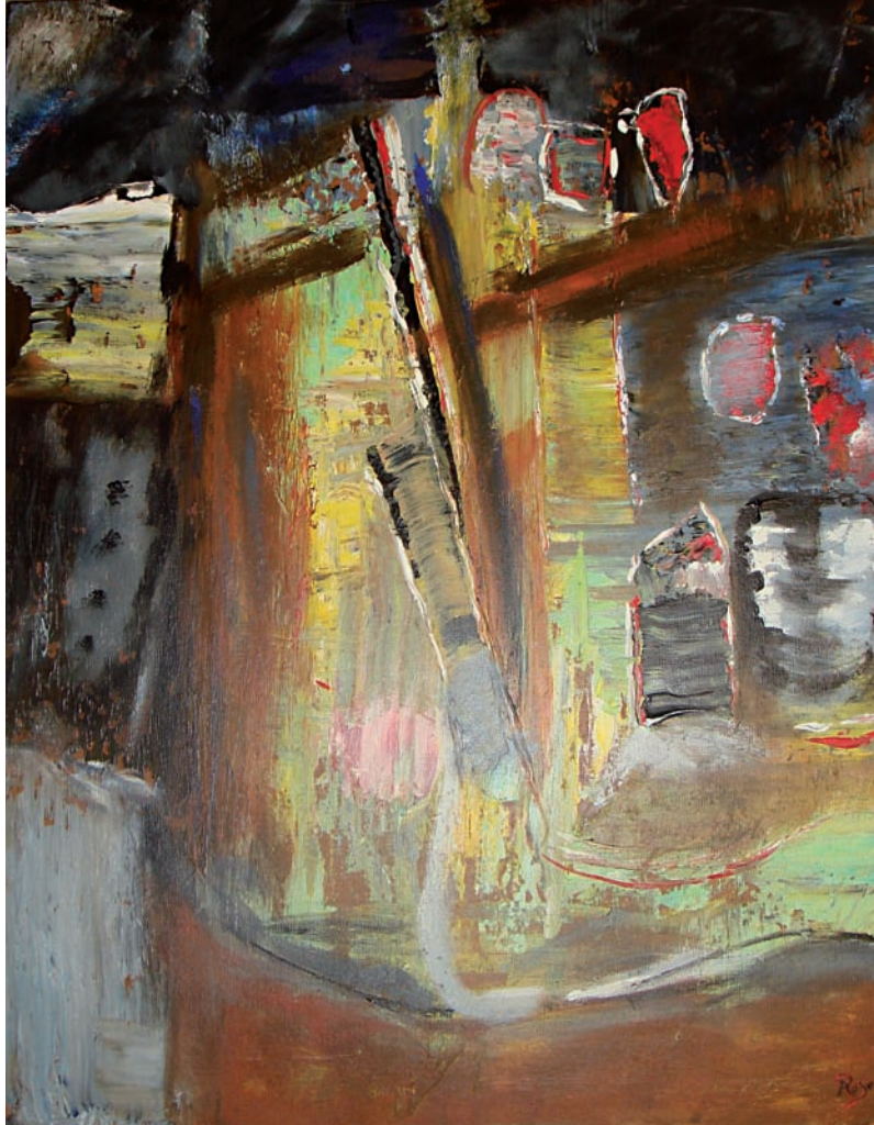
“Sense títol” – 80 x 65 cm – Tècnica: acrílic