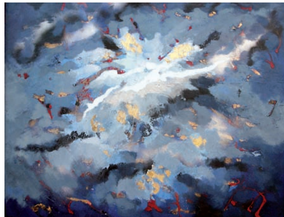
"Llum" 100 x 100 cm - Tècnica: mixta