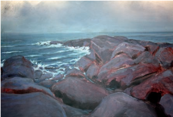
“Noviembre” 60 x 80 cm - Tècnica: Acrílic