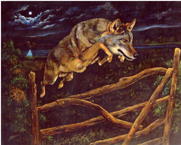
“El equilibrio de la naturaleza” 75 x 93 cm – Tècnica: oli