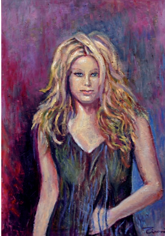
“Sense títol” 70 x 50 cm - Tècnica: oli