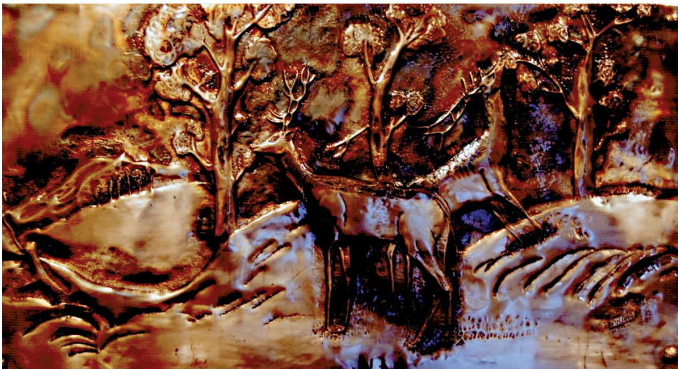
“Sense títol” 80 x 140 cm - Tècnica: ferro forjat