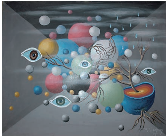
"Imaginació" 81 x 100 cm – Tècnica: acrílic