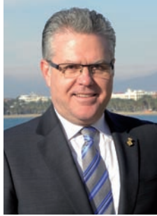
Pere Granados Carrillo Alcalde de Salou