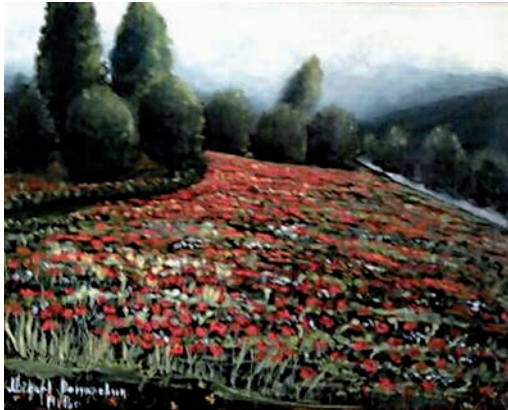
“Campo de amapolas” 40 x 50 cm – Tècnica: oli sobre llenç