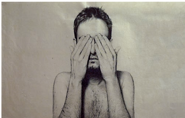
“Sense títol” 48 x 77 cm – Tècnica: tinta xina sobre paper