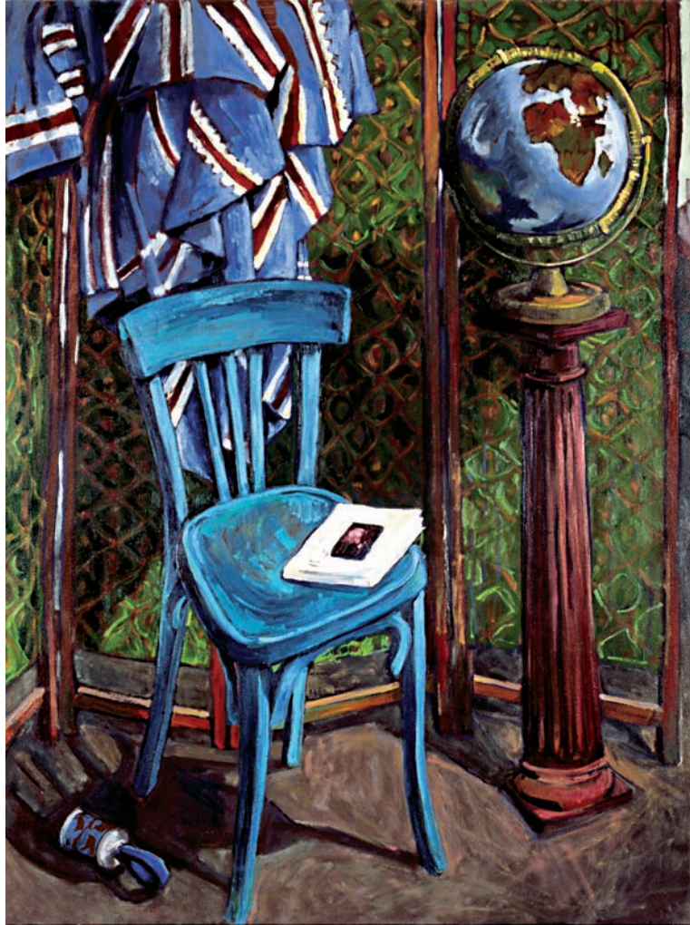
“Bleu” - 130 x 97 cm - Tècnica: oli sobre tela