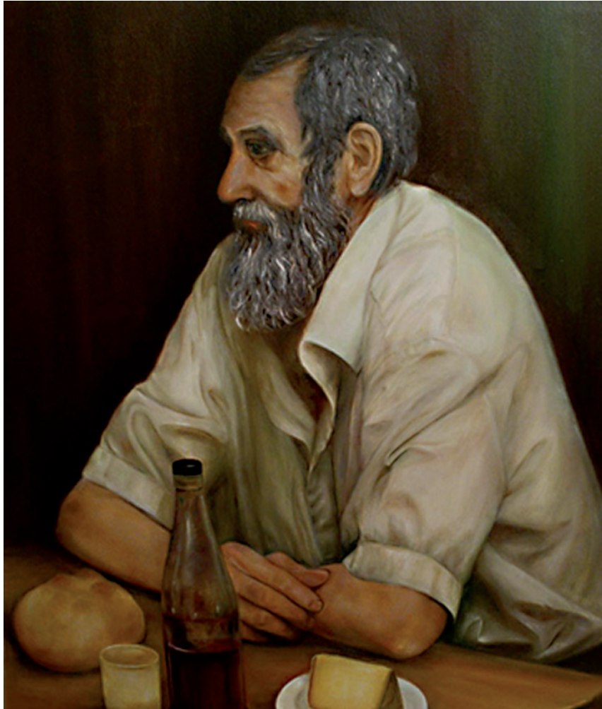
“Frugal”-100 x 81 cm - Tècnica: oli i oli a l'aigua