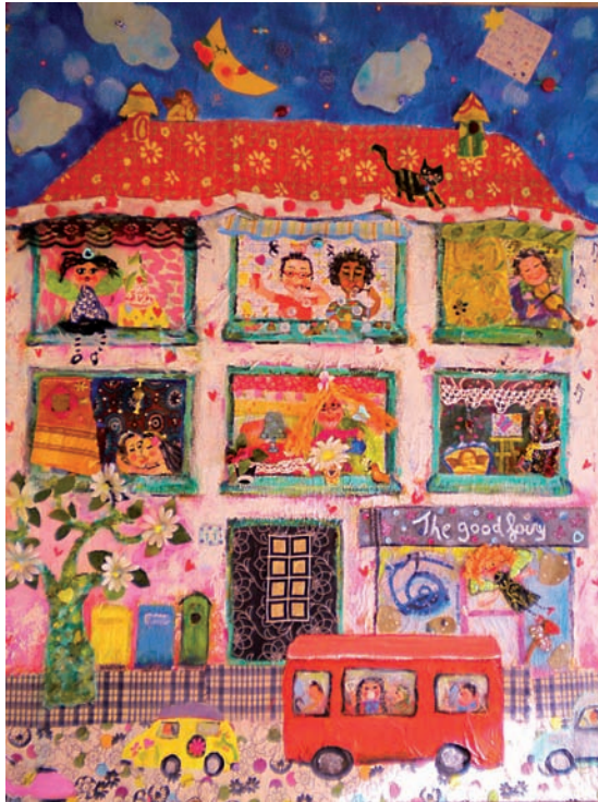
“Iris en la casa encantada” 90 x 70 cm - Tècnica: Acrílic amb collage