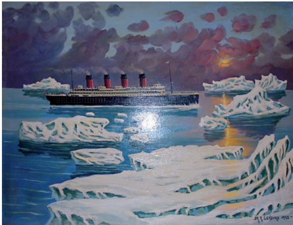
"Titanic" 89 x 116 cm – Tècnica: acrílic