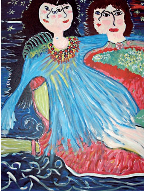
“Llum de vida” 90 x 70 cm – Tècnica: pintura plàstica