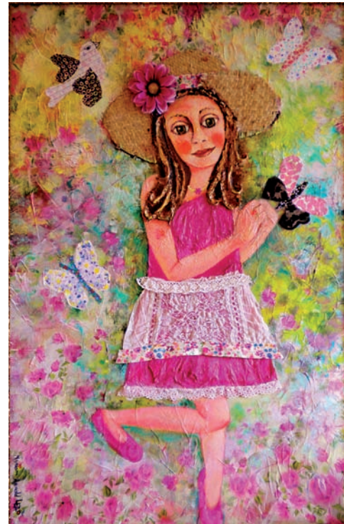
“Alba i el ball de la primavera” 120 x 70 cm - Tècnica: Acrílic amb collage