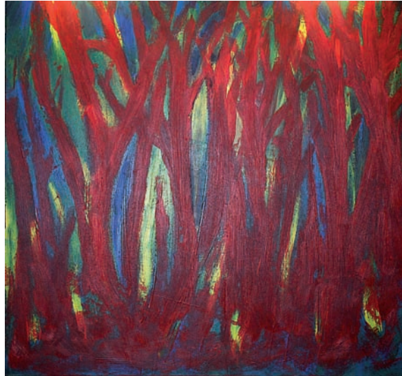
“El bosque encantado” 80 x 80 cm -Tècnica: Acrílic