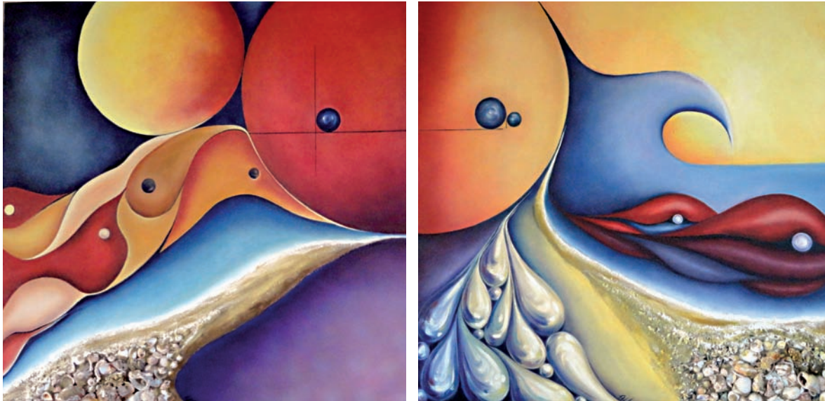
“Vida al fons del mar” – 2 obres de la mateixa mida 50 x 50 cm – Tècnica: oli collage