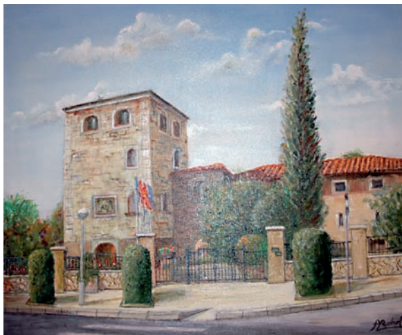
“La Torre Vella” 54 x 65 cm - Tècnica: oli