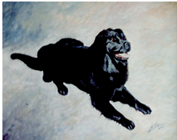
“Cuando más conozco a los hombres, más creo y quiero a los animales” 50 x 65 cm – Tècnica: oli