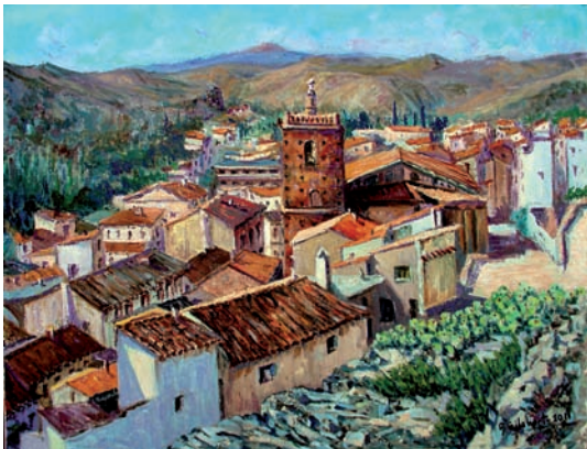
“Barrio de Santa Ana” 46 x 61 cm - Tècnica: oli