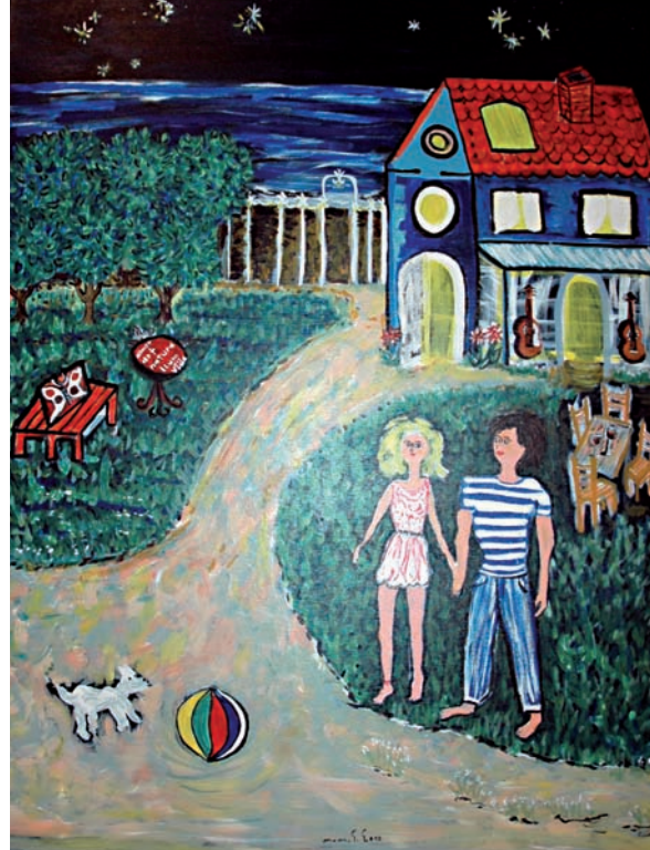
“Pare terra, mare lluna” 90 x 70 cm - Tècnica: pintura plàstica