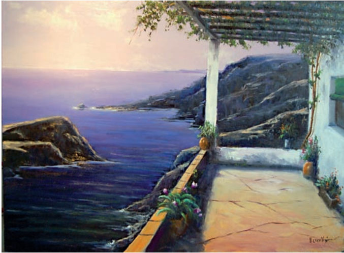
"Mediterrània" 60 x 81 cm – Tècnica: oli