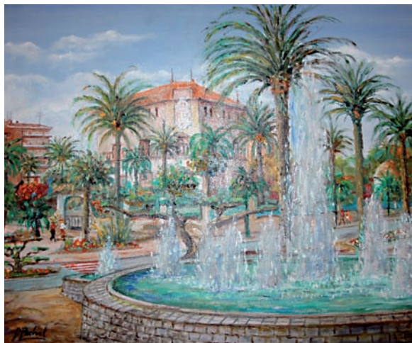
“Fonts i casa Bonet” 50 x 61 cm - Tècnica: oli