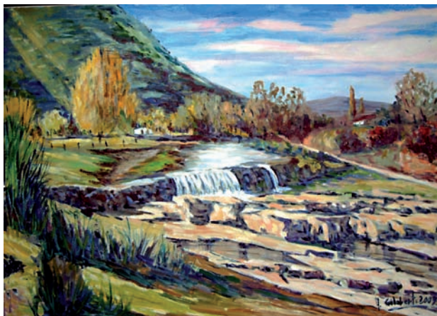
“Vista Pozo Largo” 60 x 70 cm - Tècnica: oli