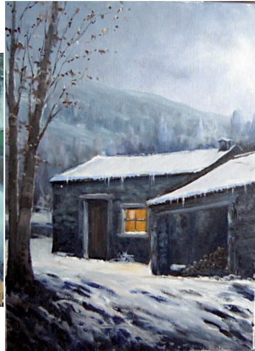
"Hivern al camí de Sant Jaume" 46 x 33 cm - Tècnica: oli