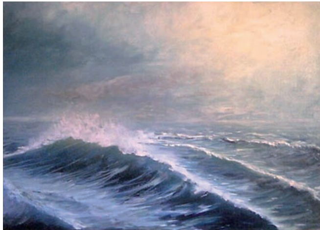
“Red moon” 50 x 70 cm – Tècnica: oli sobre llenç