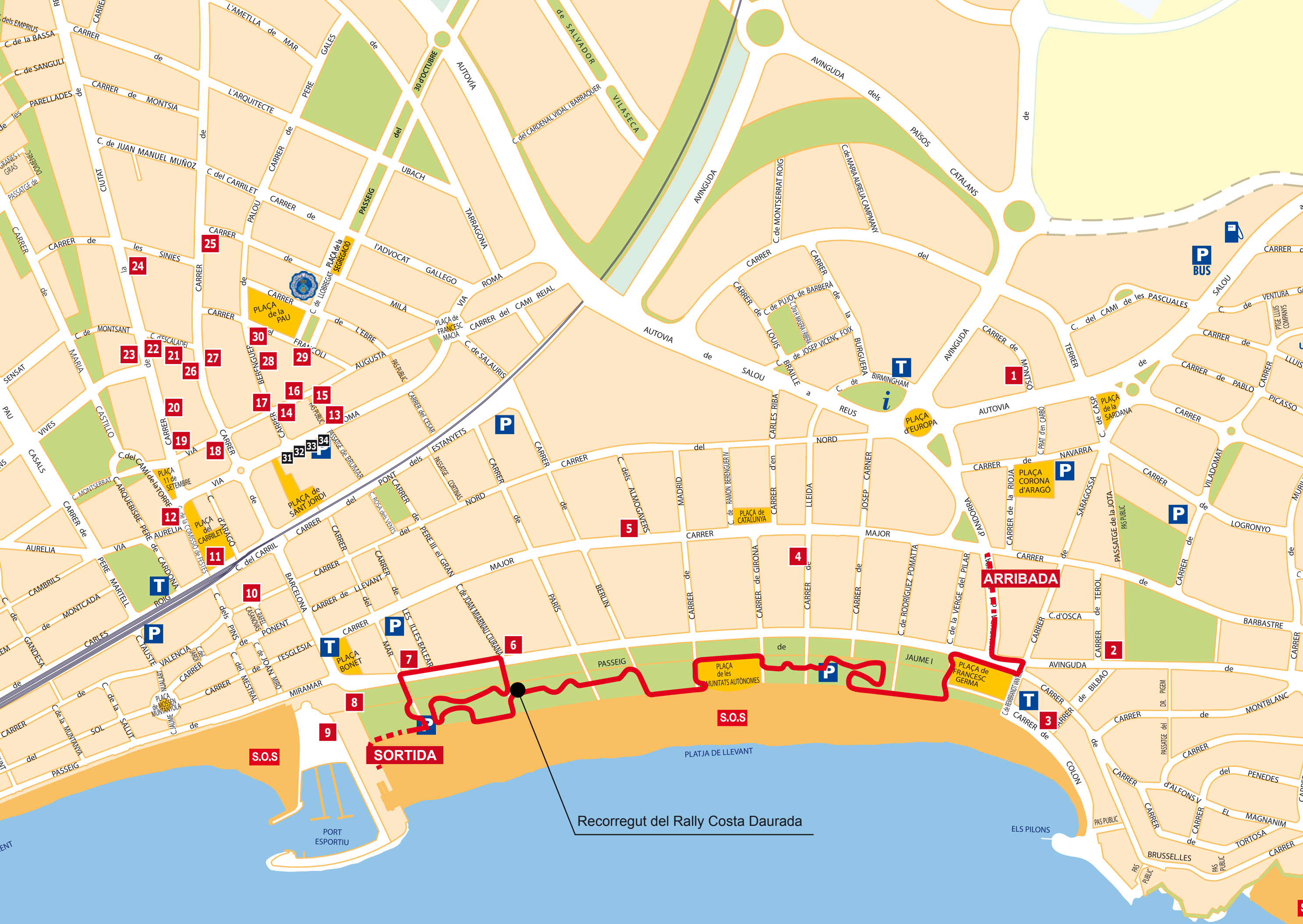
Recorregut del Rally Costa Daurada

Més informació a: www.circuitcalamar.com