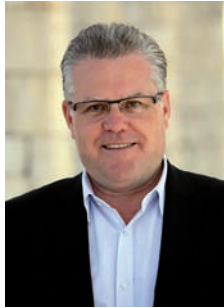
Pere Granados Carrillo Alcalde de Salou