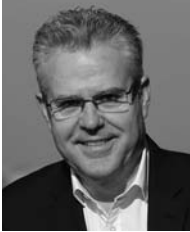
Pere Granados Carrillo Alcalde de Salou