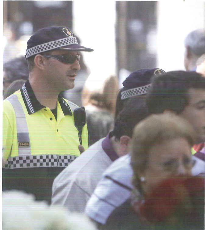
El servei de policia local és un dels que s'han de reforçar a causa del turisme.

Els serveis que en els municipis turístics veuen augmentar la seva despesa a causa de l'increment de població flotant són els serveis policials, neteja viària, recollida de residus, jardineria o manteniment de platges, juntament amb d'altres referents a l'oci, la cultura o la promoció. Un exemple molt visual és que en una població de 25.000 habitants la despesa anual en seguretat puja fins als 2