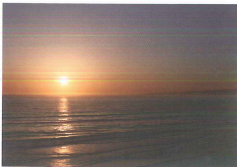
El sol i la platja són un dels grans atractius.