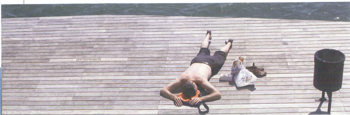
La neteja de la via pública i de les platges també són serveis municipals que requereixen més finançament. (Foto: Adrià Costa).