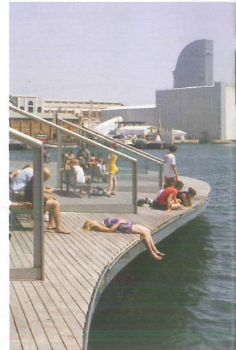
Alguns municipis multipliquen per vuit la seva població, arran del turisme. (Foto: Adrià Costa).

L'augment de població producte del turisme obliga als municipis a redimensionar serveis. (Foto: Adrià Costa).