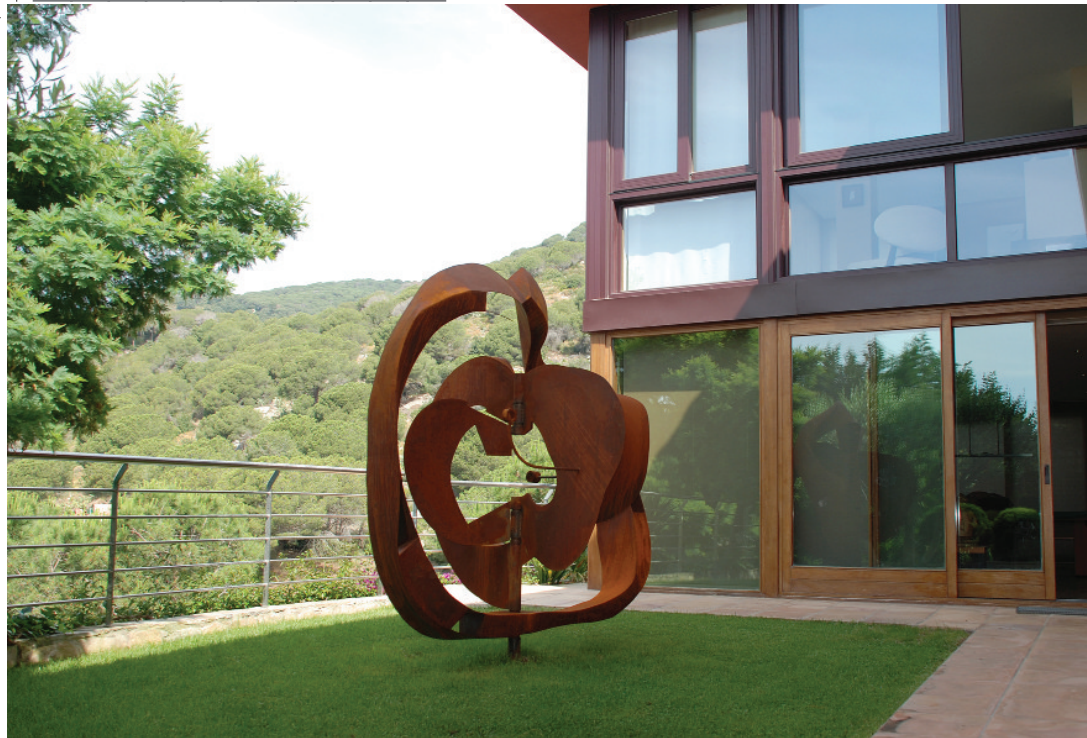
Manzana de la concordia acero corten / 220x220x220 / 2009 Colección particular en Barcelona