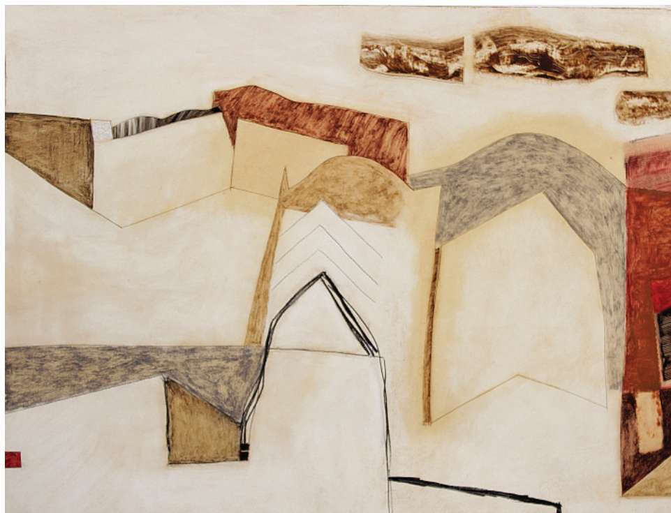
Azotea y nube marrón óleo sobre cartón / 60x45 / 2001

Alicia Haber El País / Uruguay 6 de Marzo de 2001