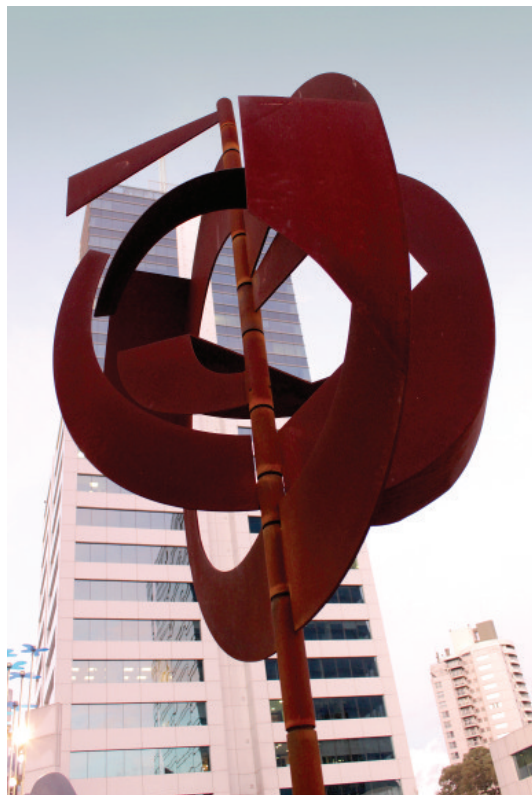
Fruta espacial acero corten / 250x150x150 / 2009 World Trade Center en Montevideo