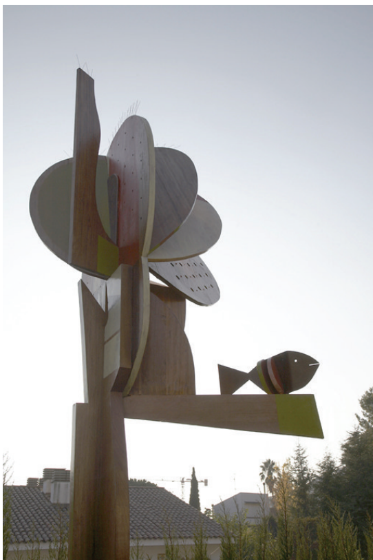
Árbol de la vida madera policromada, acero / 500x150x150 / 2004 Colección particular en Barcelona