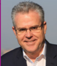
Pere Granados Alcalde de Salou