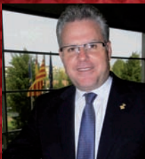
Pere Granados Carrillo Alcalde de Salou