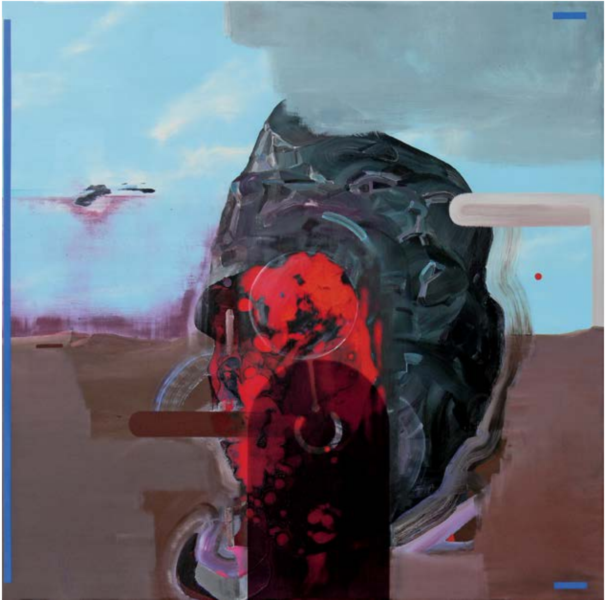
Experimento 2 / 2015 Técnica mixta detrás / sobre metacrilato / 90 x 90 cm