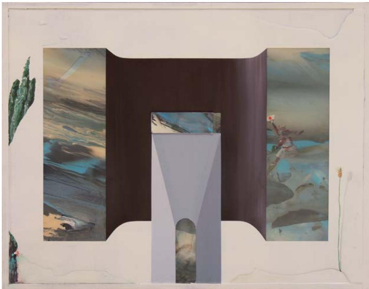
El transmisor figurativo-matérico / 2014 Técnica mixta detrás / sobre metacrilato / 68 x 88 cm