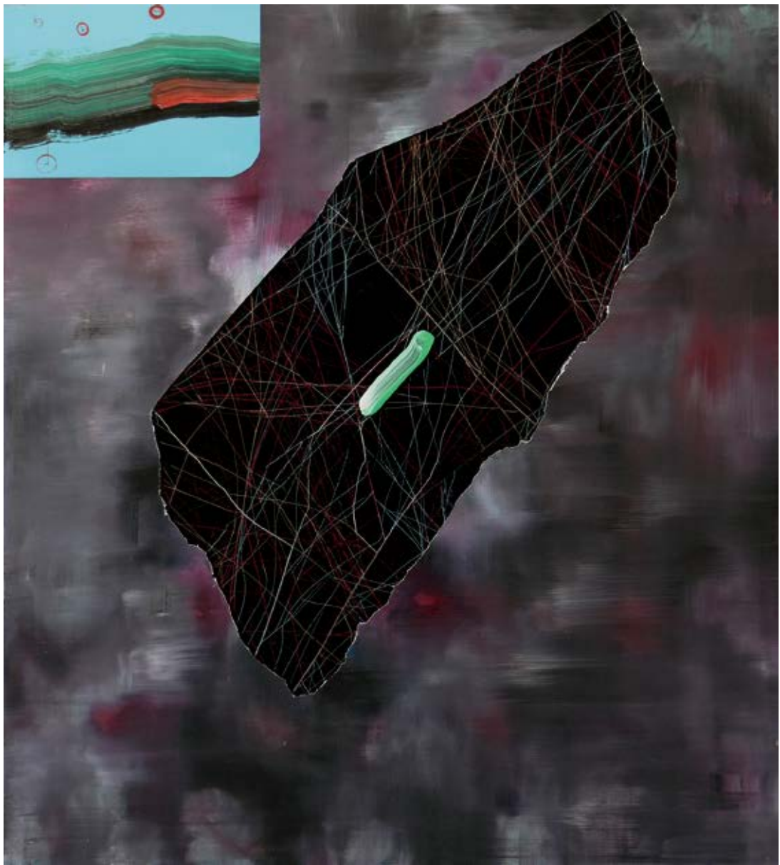
Objeto volador no identificado / 2015 Técnica mixta detrás / sobre metacrilato / 50 x 45 cm