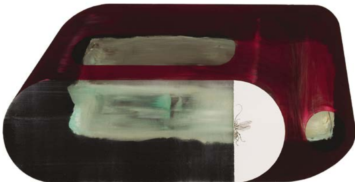
Pigmentador. Periplaneta Australasiae / 2013 Técnica mixta detrás / sobre metacrilato / 60 x 79 cm