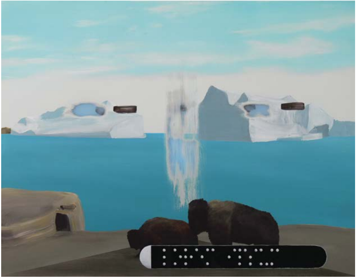
Lorem ipsum / 2015 Técnica mixta detrás / sobre metacrilato / 50 x 66 cm