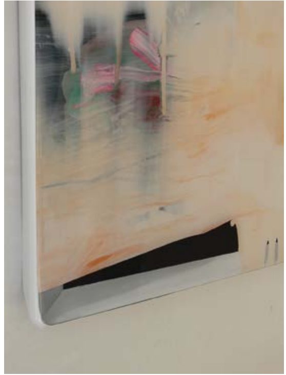
Mars Polar Lander / 2015

Técnica mixta detrás / sobre metacrilato / 90 x 90 cm