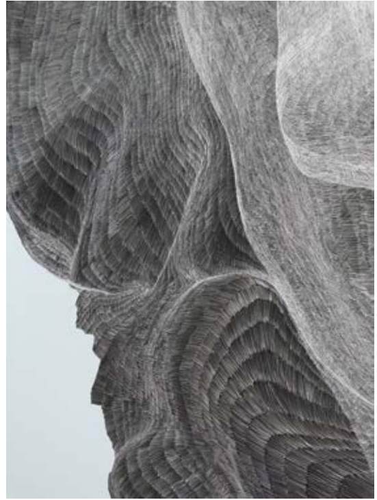
La talla de los tres picos / 2014 Técnica mixta detrás / sobre metacrilato / 180 x 150 cm