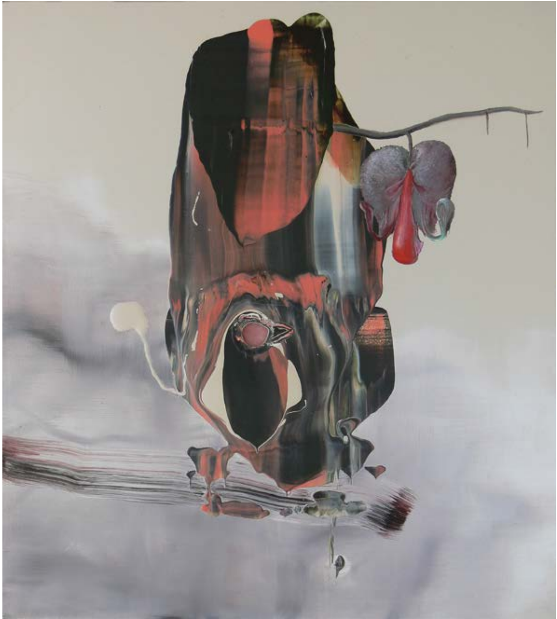
Ecosistema bidimensional / 2015 Técnica mixta detrás / sobre metacrilato / 50 x 45 cm