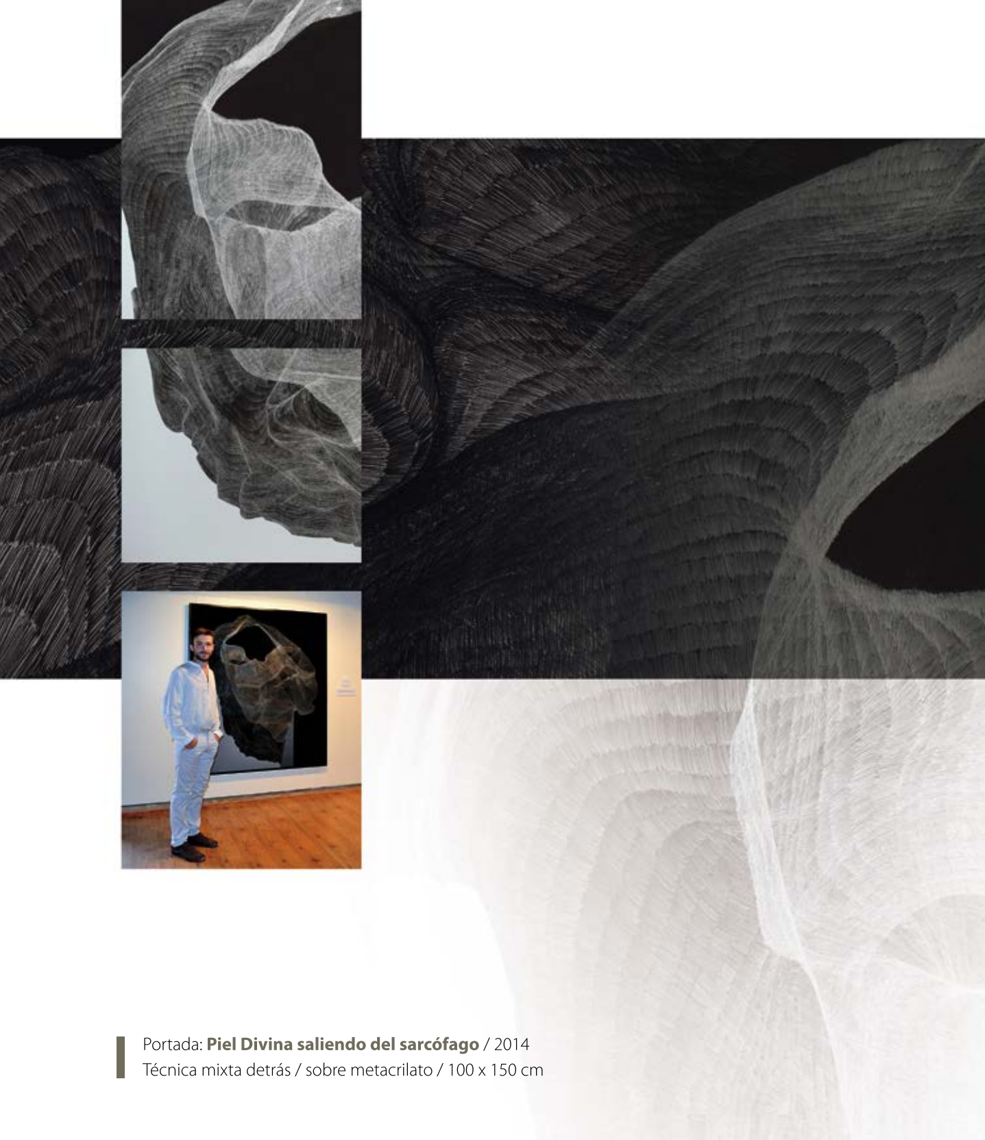
Portada: Piel Divina saliendo del sarcófago / 2014 Técnica mixta detrás / sobre metacrilato / 100 x 150 cm