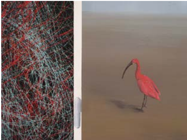
Entradas de Ibis a Iconostasis / 2014 Técnica mixta detrás / s. metacrilato / 122 x 122 cm