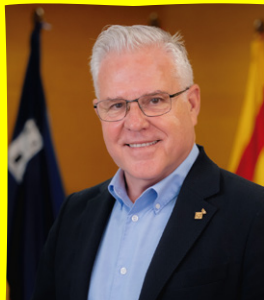
Pere Granados Carrillo Alcalde de Salou

Tornem a unir-nos per celebrar la nostra Festa Major d'Hivern. Aquest any hem preparat una programació excepcional, amb uns setanta actes pensats per a tots els públics i edats, amb l'objectiu que tothom pugui gaudir d'aquests dies plens d'alegria, cultura i tradició.