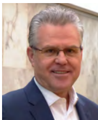
Pere Granados Carrillo Alcalde de Salou