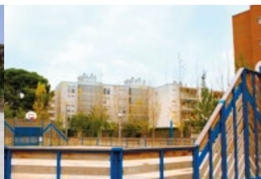
PISTA ESPORTIVA , C/ Maria Castillo