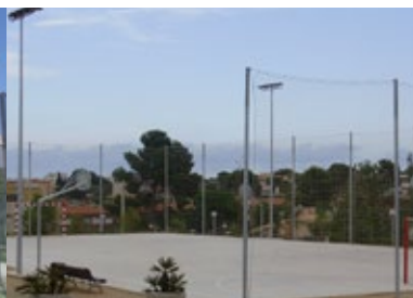
PISTA ESPORTIVA , Zona Estival