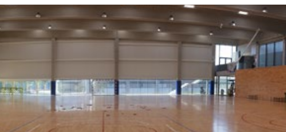
PAVELLÓ PONENT SALOU , C/ Maria Castillo, 13-15 T. 977 309 211