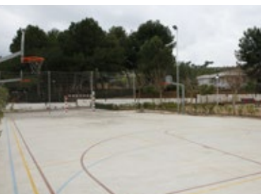
PISTA ESPORTIVA , Urb. Xalets de Salou