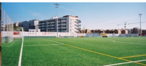
ESTADI MUNICIPAL C/ Barenys T. 977 384 050