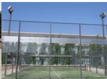
PISTES PÀDEL , C/ Maria Castillo, 13-15