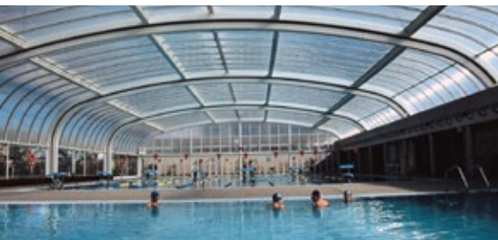
PISCINA MUNICIPAL , C/ Mià,3 T. 977 309 210