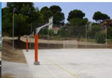
PISTA ESPORTIVA , Urbanització Mirador