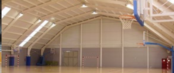
PAVELLÓ CAP SALOU , C/ Fonoll, s/n T. 977 309 211