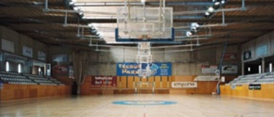
PAVELLÓ SALOU CENTRE , C/ Mià,3 T. 977 309 211