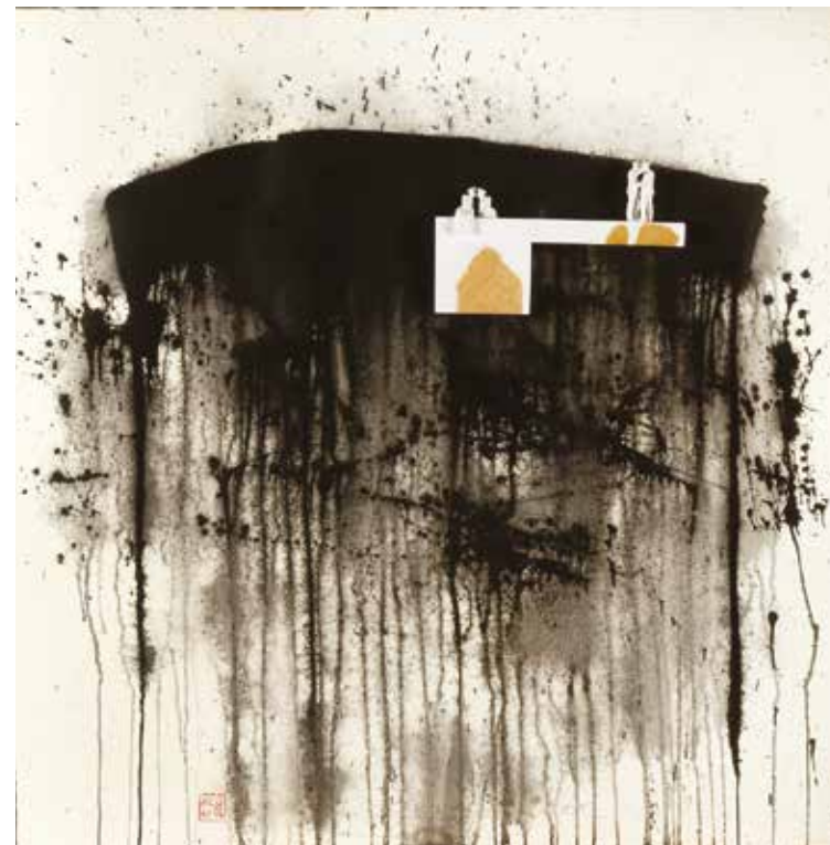
AMORES PROPIOS - acrílic, fusta i figures de resina sobre paper artesà 75 x 75 cm - 2012