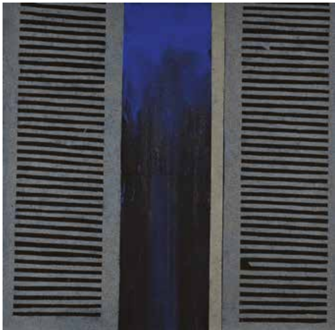
PERPINYÀ 1 - mixta i sorra sobre fusta - 100 x 100 cm - 2018