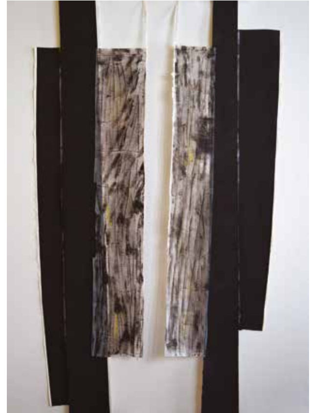
LA TOGA - mixta sobre paper - 150 x 113 cm - 2018