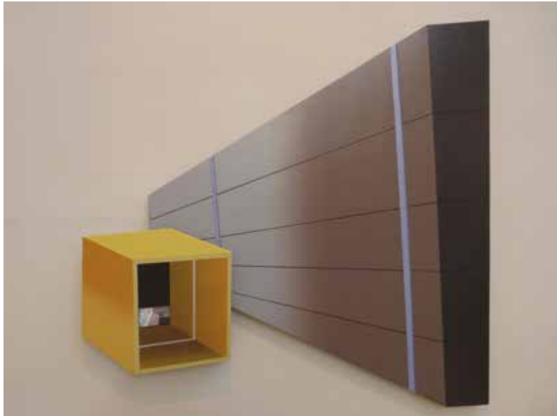
19-2016 - tècnica mixta sobre tela - 96 x 146 cm - 2016