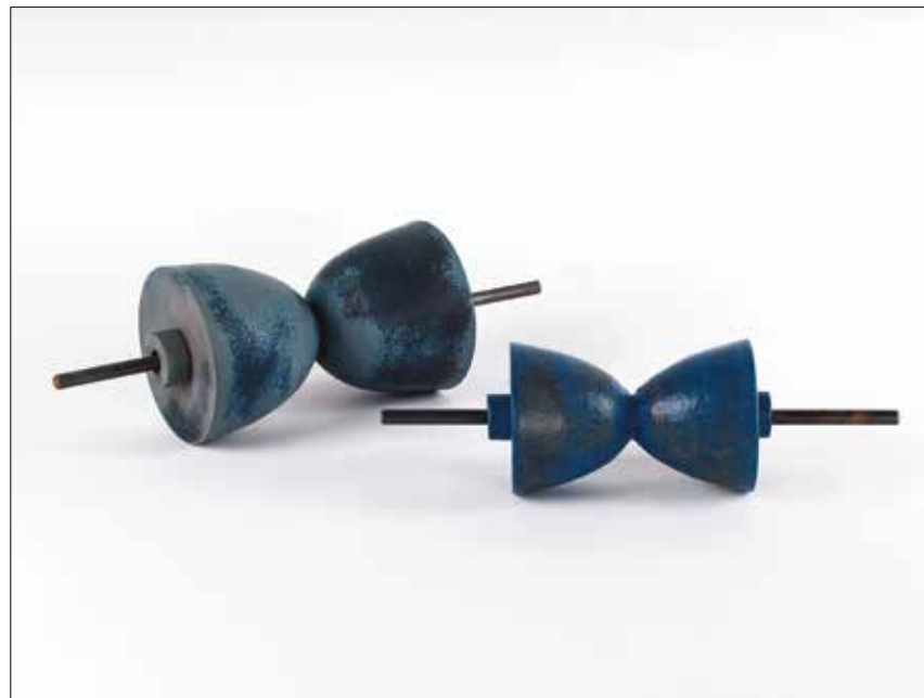
MI JUEGO - gres, vidriat i ferro - conjunts a. 35 x 13 x 13 cm b. 35 x 10 x 10 cm - 2017