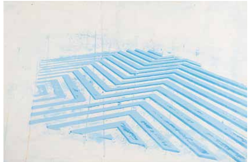
19/2016 - tècnica mixta i frottage sobre tela - 97 x 146 cm - 2016