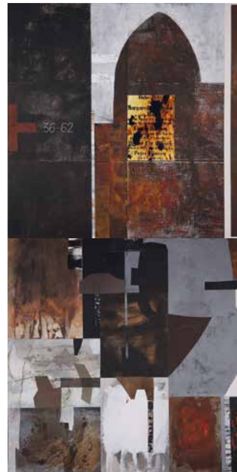
UN LETTRE DE MAMAN detall - collage sobre tela i fusta - 150 x 76 - 2012