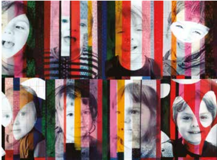
TEO/BRUNA/MATILDA/MOLI - mixta sobre làmina polièster - 59 x 84 cm