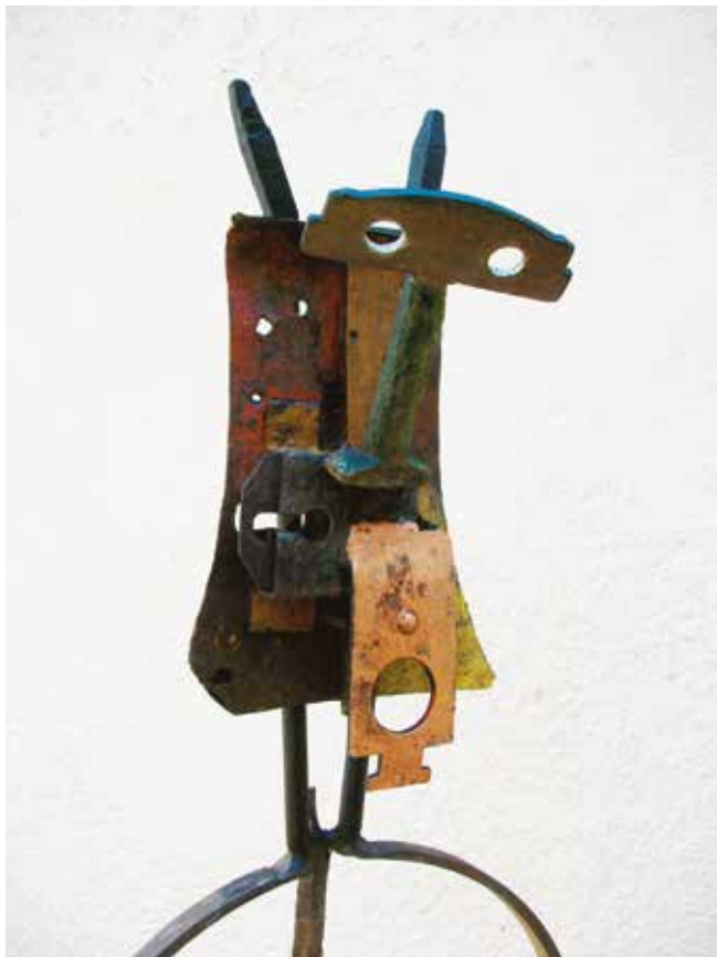
FAUNE BOCABADAT detall - ferro i pintura - 180 x 31 x 20 cm - ref. 83511

LA CULTURA ÉS L'ALIMENT I L'ART ÉS LA DELICATESSEN