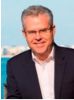
PERE GRANADOS ALCALDE DE SALOU