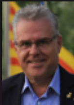
Pere Granados Alcalde de Salou