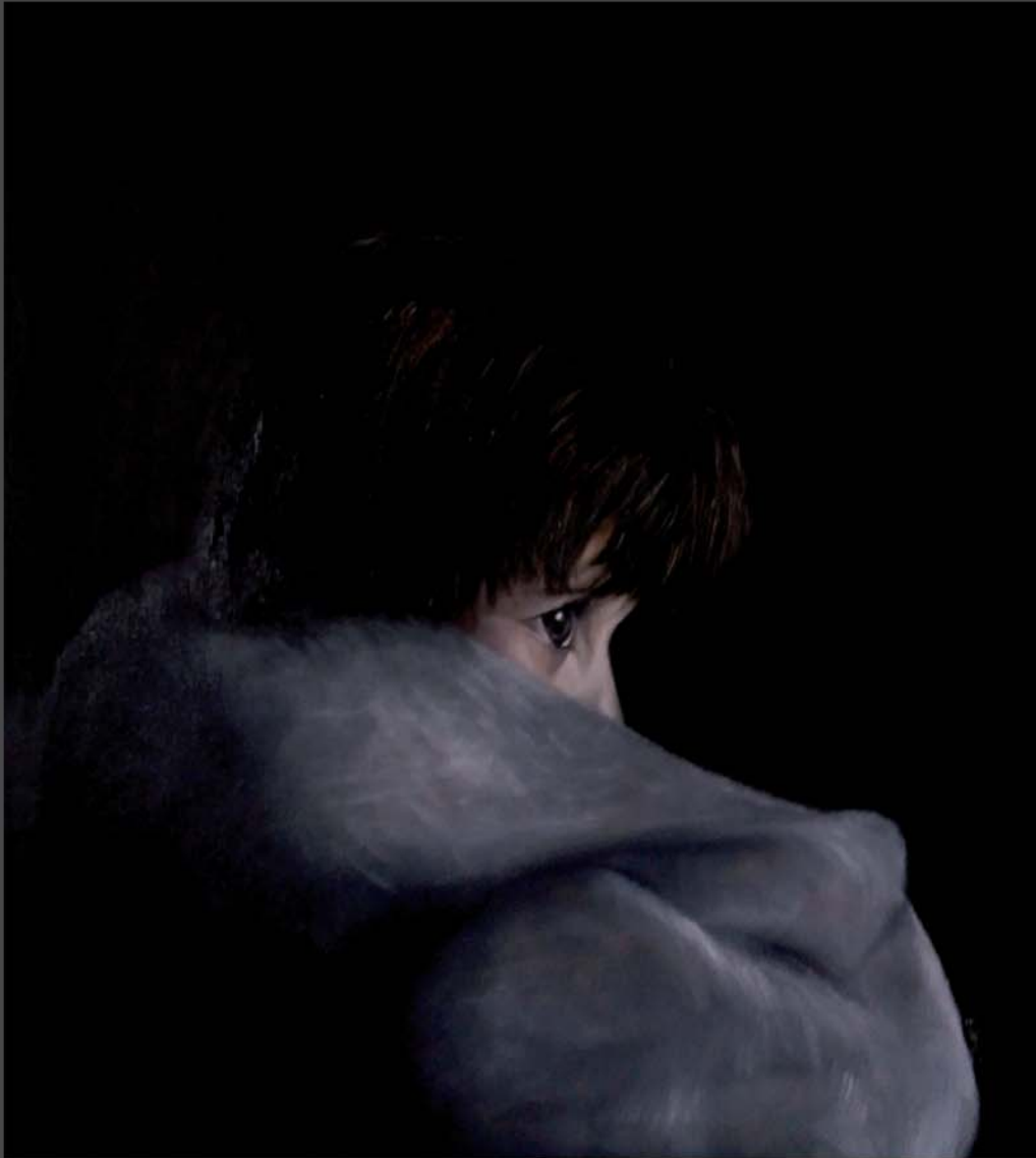
Ivette Óleo 55 x 55 cm