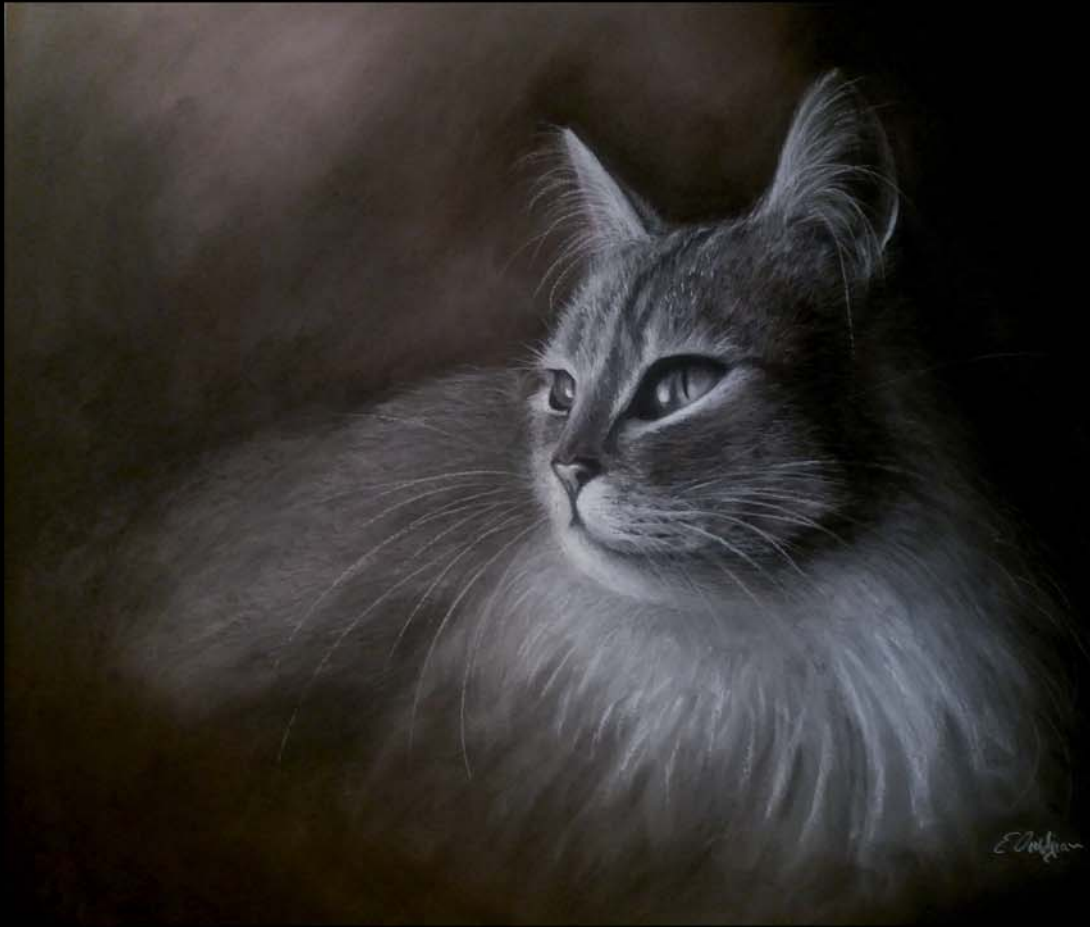
Bosque Noruega Pastel 50 x 60 cm