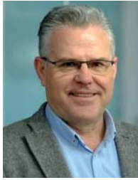
Pere Granados Carrilo Alcalde de Salou