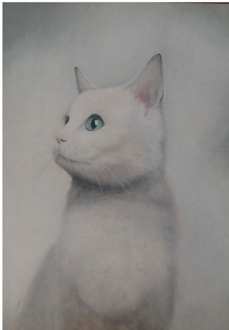
Blanco Óleo 46 x 61 cm.