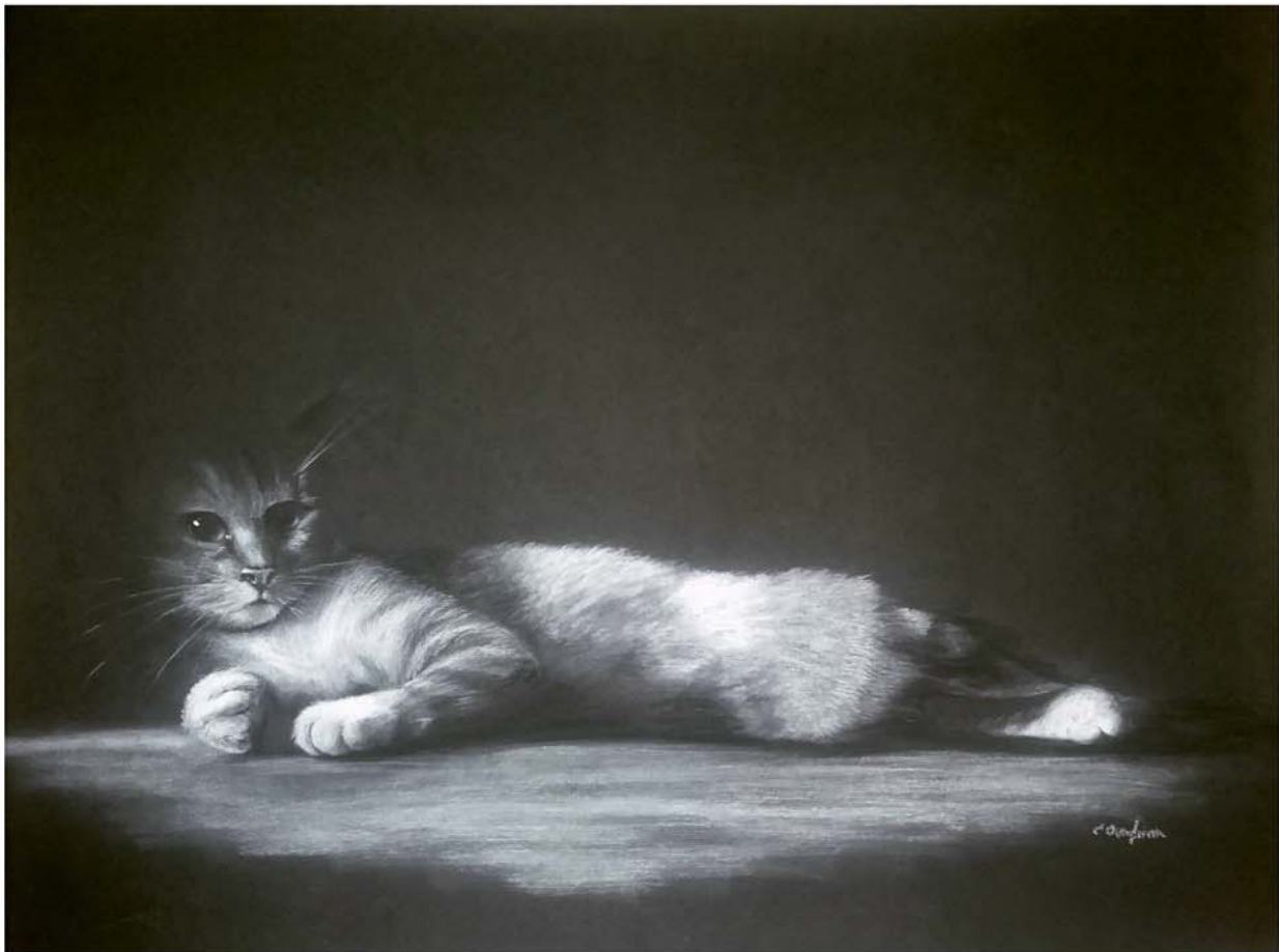
En penumbra Pastel, 48 x62 cm