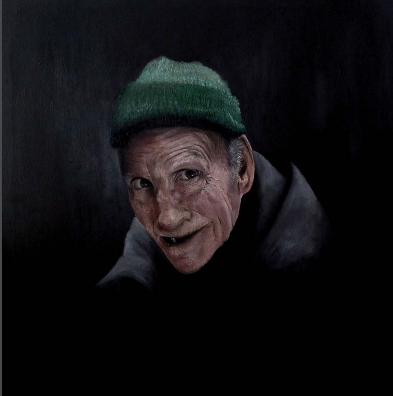
Un señor de mi pueblo Óleo. 61 x 61 cm