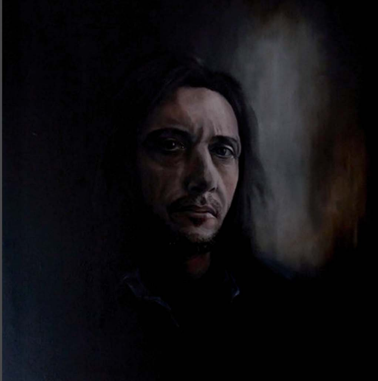
Don Enrique Óleo, 61 x 61 cm