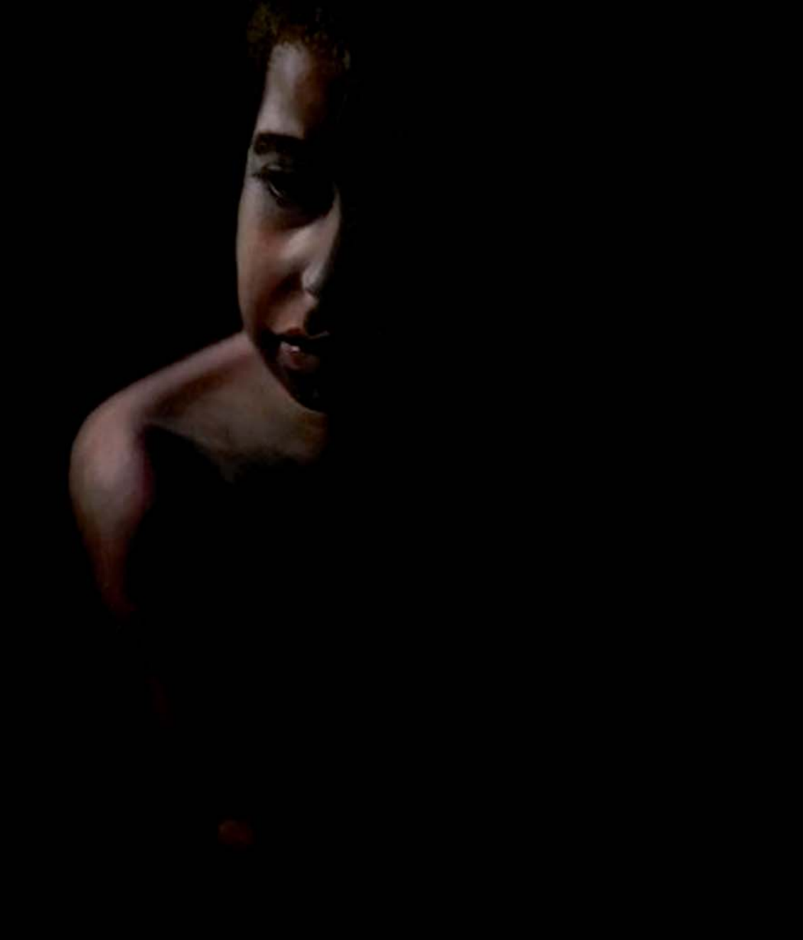
Leo Óleo, 50 x 40 cm