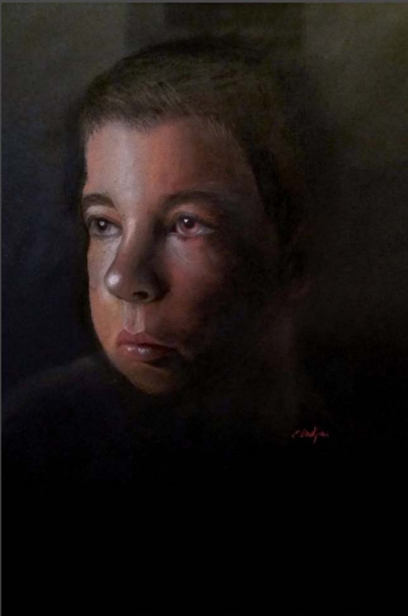
1840 Pastel 48 x 32 cm