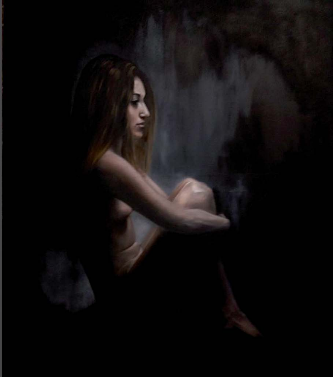
Claudia Óleo 89 x 130 cm