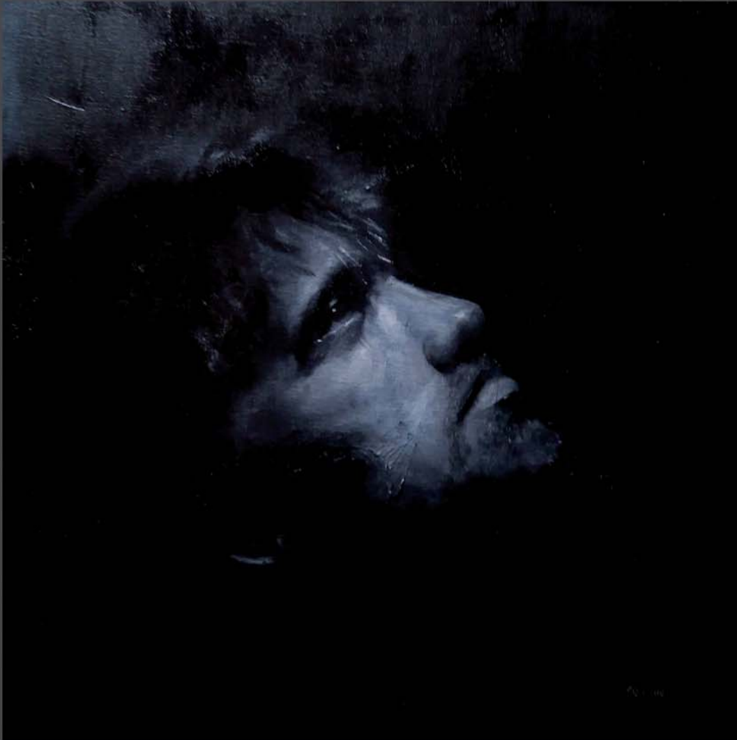
Roger Nolla Óleo, 40 x 40 cm