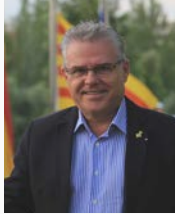
Pere Granados Carrillo Alcalde de Salou